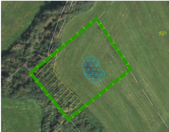
Abb. 3: Maßnahmen in der Ausgleichsfläche auf Flur Nr. 1582 Gmkg. Oberwöhr: Erweiterung der Seige (blau) und Gehölzreduktion (gelb schraffiert)