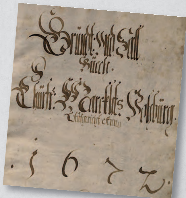
Titelseite des „Grundt- und Sallbuech - Churfr. Marckhts. Vohburg 1672“

Wenn man die Namen seiner Vohburger Ahnen kennt, wird man zuletzt womöglich im Stadtarchiv fündig. Dort befinden sich hunderte Dokumente, die die Vohburger Bürger in ihren Epochen beschreiben. Darunter ist auch das Vohburger Grund- und Salbuch von 1672. Dieses alte Dokument lässt die Familiengeschichte alter Vohburger Familien lebendig werden, ist aber leider schwer leserlich. Erst vor kurzem wurde deshalb das Dokument in einer „modernen“, leicht lesbaren Version in den Blättern des Bayerischen Landesvereins für Familienkunde (BBLF 86, Jahrgang 2023) veröffentlicht. Ziel dieser Veröffentlichung war eine wortgetreue Wiedergabe des Grund- und Salbuchs mit ausführlichen Erläuterungen, sowie die Analyse der räumlichen, sozialen und finanziellen Gegebenheiten in Vohburg im Jahr 1672.