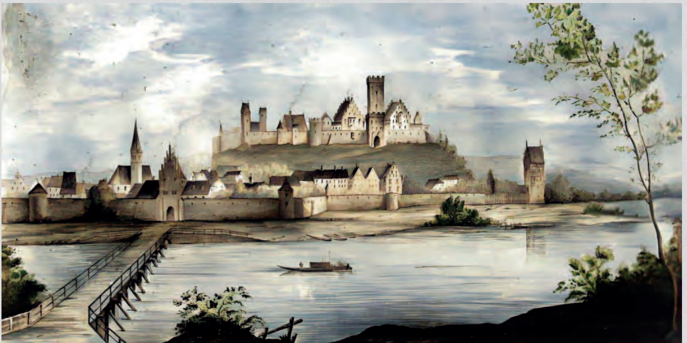
Vohburg von Norden, um das Jahr 1600. Gemälde nach Hans Donauer dem Älteren.

Diese Fragen hat sich der eine oder andere Vohburger Bürger bestimmt schon einmal gestellt. Was nur wenige wissen: Viele Quellen für die Familienforschung sind offen zugänglich. Jährlich kommen immer neue Quellen hinzu, die auch von zu Hause im Internet aufgerufen werden können. Diese Quellen zeigen, wie die eigenen Vorfahren tatsächlich vor hunderten von Jahren in Vohburg gelebt haben.