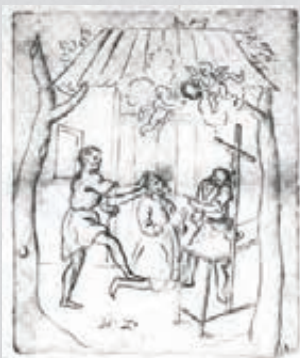
Skizzen eines Bilderzyklus aus dem Leben des Seligen Bauern, der für St. Anton geplant war.

1707, 28. Octob.. Cunigunda Glowiserin Würthin zu Dinzing hat einen khranckhen Ochsen mit Gebett und silbernen Opfer sambt einem gemalten Taflein zu dem hl. Paurn verlobt, darauf sich Bösserung bezaigt. (Nr. 237)