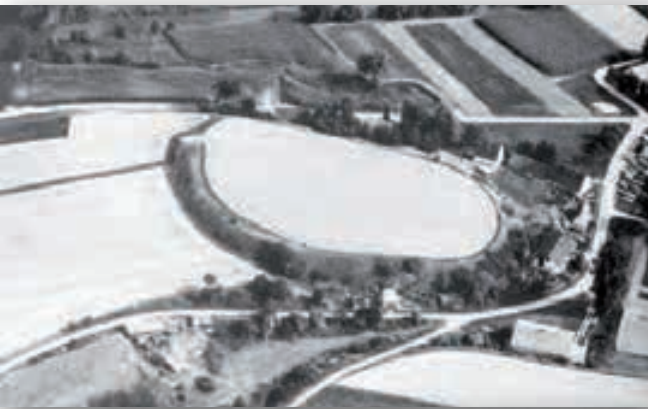
Olberg und Burggraben – eine mittelalterliche Abschnittsbefestigung