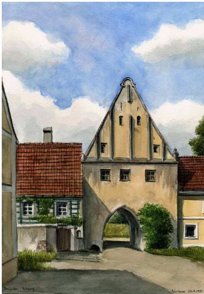
Ansicht von Süden von O. Lindauer, 1999

Nach der Fertigstellung wird man der Bevölkerung nochmals Gelegenheit geben, dieses Aushängeschild zu besichtigen.