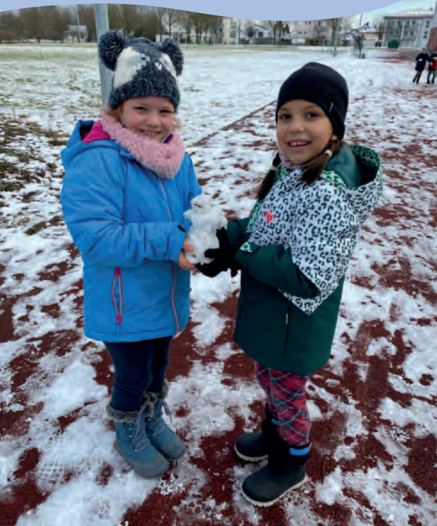
Schnell wurde noch ein Mini – Schneemann aus den letzten Resten Schnee gebaut.