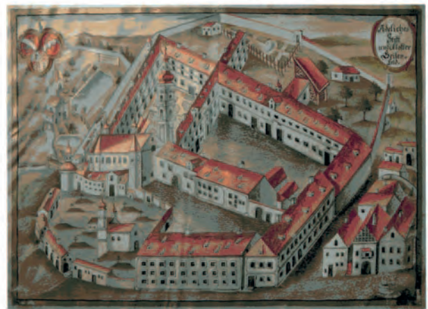
Abb. 1: Adeliges Stift und Kloster Geisenfeld. Kolorierte Federzeichnung aus dem Rotelbuch, 1779. Neben dem Klosterbezirk samt Kirche, Wirtschaftsgebäuden, Gärten und Fischteich sind links unten die nicht kloster eigenen Gebäude Allerseelenkirche, Pfarrkirche St. Emmeram mit umgebenden Friedhof, Fleischbank und Schranne dargestellt.